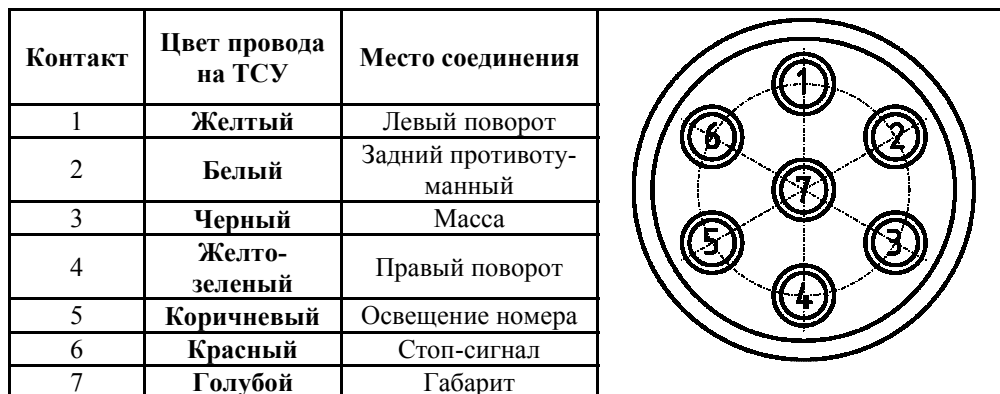
СХЕМА МОНТАЖА ТСУ